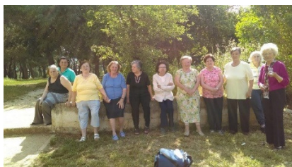
u neposrednoj blizini OŠ Vidikovac

Kad god vremenske prilike dozvoljavaju, organiziraju se šetnje u ograđenom prostoru ispred Cjelodnevnog boravka. Korisnicima se ukazuje na vremenske promjene, promjene u godišnjim dobima i sl. Šetnje oko kvarta organiziramo za pokretnije korisnike.